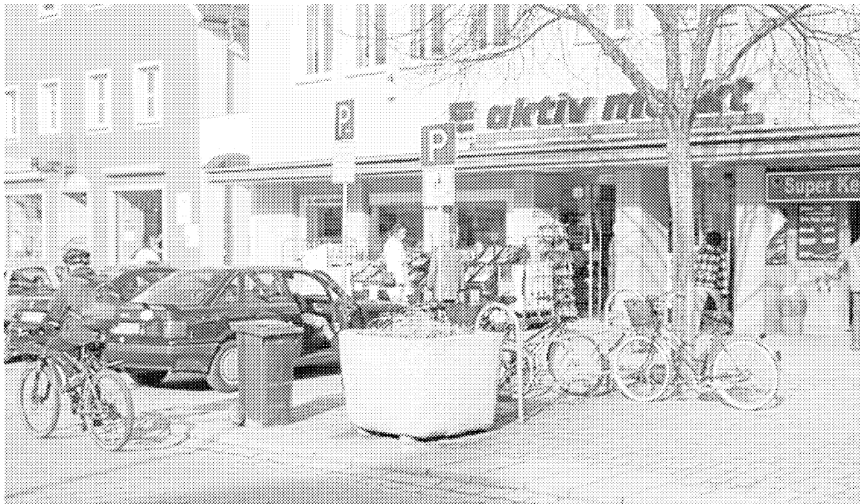
Über Monate hinweg hielten sich die Gerüchte, nun ist es raus: Die Edeka-Filiale am Unteren Markt schließt.